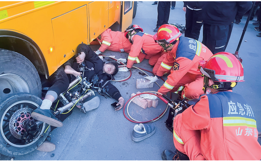
消防救援人员营救被卡在车底的男子。