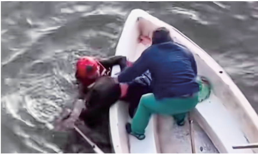
消防救援人员和热心市民在营救老人。