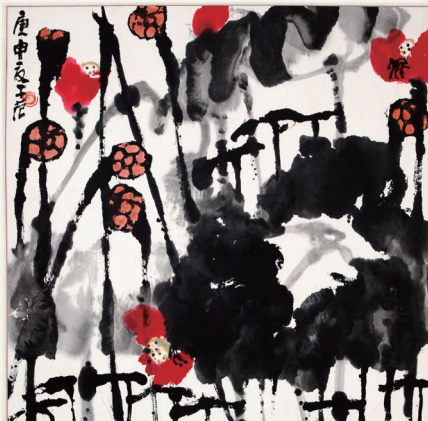
崔子范作品《迎风醉露》。

在莱西市的文化路上,有一座中国四合院式的仿古建筑,背倚月湖公园,面对洙河长堤,这里正是以艺术大家崔子范名字命名的美术馆。崔子范美术馆由山东省青岛市莱西市人民政府与我国著名国画大师崔子范先生共同兴建,于1998年11月奠基,1999年9月落成。这一美术馆陈列、研究崔子范先生不同时期的书画作品及生平资料的同时,也在开展着广泛的艺术交流,以及各类学术活动,书写着“真大写意”莱西市展览品牌的荣光。