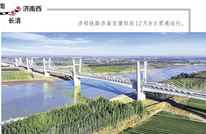
济郑铁路济南至濮阳段12月8日贯通运行。

早报12月7日讯 12月7日,记者从中国国家铁路集团有限公司获悉,济南至郑州高速铁路济南至濮阳段(以下简称济郑高铁济濮段)12月8日建成通车,标志着济郑高铁全线贯通运营,济南西至郑州东站间最快1小时43分可达。其