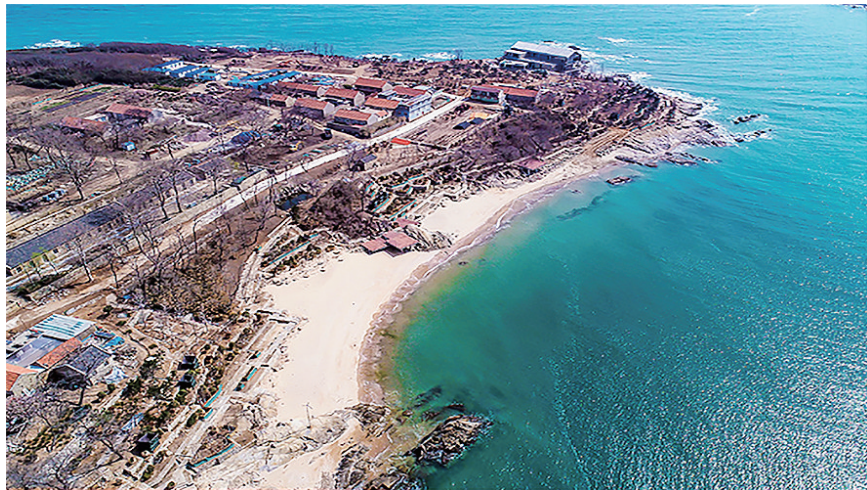
小管岛岸线修复后。

崂山湾横跨崂山区、即墨区两个国家级生态文明示范区,东起即墨区女岛,西至崂山区崂山头,背靠崂山,面临黄海,湾内的大小管岛分别入选齐鲁最美海岛、青岛市最美海岛;湾内有“中国沿海最美乡村”青山渔村、“全国乡村旅游重点村”晓望村,10个渔村荣获“市级特色渔村”,形成“村村有特色,处处是风景”的沿海乡村风貌;有被称为“天然明珠”的仰口海水浴场;被誉为“医疗矿泉”的即墨溴盐温泉,是世界上仅有的四个海水溴盐温泉之一。青山、绿水、碧海、蓝湾、翠岛、温泉、银滩的独特自然景致造就了“青山绿野真秀色,碧海银滩多奇观”的自然风光。