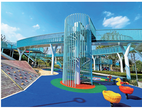
深圳路体育公园。

新建校、薄弱校加快成长为优质校。强化数字技术赋能教育教学,成功入围山东省智慧教育示范区。2023年,全区中考优质普高录取人数和一段线达线率分别比5年前提高4.2倍和3倍。