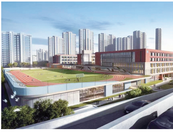
浮山九年一贯制学校规划图。