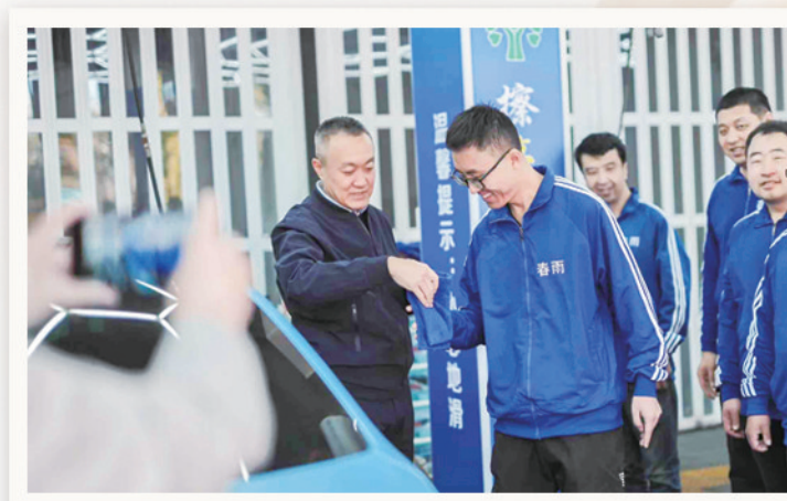
左图:他们的洗车服务赢得顾客赞扬。