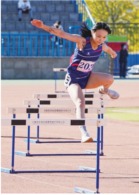
“恒星学院杯”青岛高校田径运动会。

青岛恒星科技学院集体育学院的教学、学校体育场馆的运营和学校人才的高效输出为一体,借助青岛恒星文化体育产业有限公司的专业运作,构建产学研相融的体育产业经营新业态。与青岛市体育产业发展中心达成战略合作,全面启动“六一”产教融合公益工程,开青岛体育产业人才融合发展先河。让我们走进青岛恒星科技学院,探索创新体育产业发展的“恒星模式”。