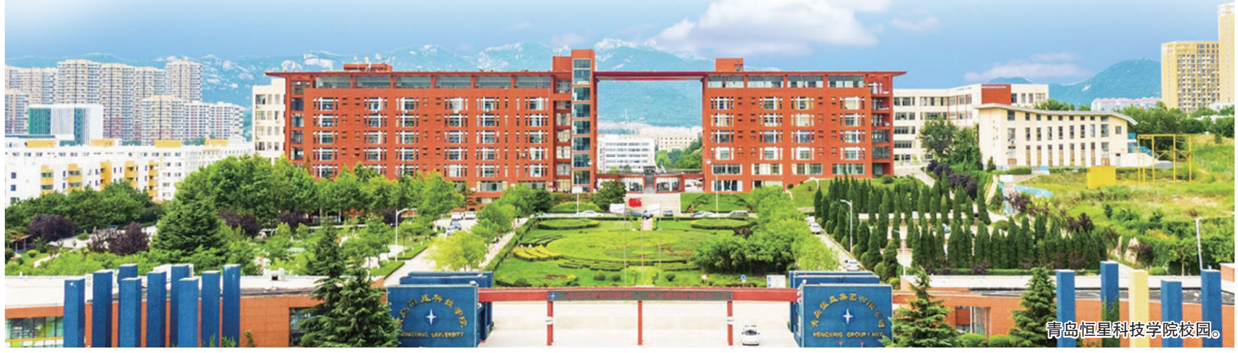
青岛恒星科技学院校园。

“‘恒星篮球少年梦’项目即我校与青岛市体育发展中心合力打造。双方将共建实践教学基地、培养篮球教练指导员,面向幼儿园、小学、初中开展篮球普惠性教育教学工作,在共同完善竞赛体系、畅通竞技体育人才选拔等方面开展一系列活动。届时,由青岛市教育局选