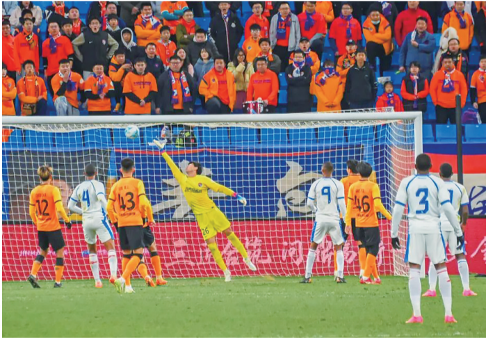
2.9万多名岛城球迷现场观看“牛马大战”。

《青岛市“十四五”体育事业发展规划》确立青岛到2025年,初步建成全球知名体育城市和国家体育中心城市。到2035年,率先建成体育强国,基本建成全球知名体育城市和国家体育中心城市。《规划》明确了青岛要建设“六大功能中心”:一是大力发展群众体育,建设国家全民健身示范中心;二是实施奥运争光计划,孵化国家竞技体育人才输出中心;三是加大赛事招引培育力度,打造国家体育赛事中心;四是扩大体育产品和服务供给,建设国家体育消费中心;五是加快体育制造转型升级,培育国家体育产品研发制造中心;六是促进要素集聚耦合,构筑区域体育资源配置中心。而全国大赛频频落户青岛,不仅有助于我市打造国家体育赛事中心,也是青岛多年来深耕赛事结出的硕果。硬件设施是承办比赛的最基本条件,而赛事服务更是国内大赛频频选择青岛的重要因素。