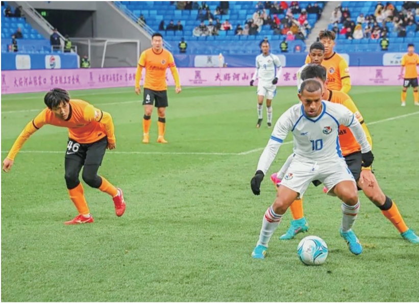
青春足球场成功举办巴拿马国家队对阵青岛海牛队的比赛。

在建设国家体育赛事中心方面,青岛一直致力于申办创办更多国际国内高水平体育赛事,今年多项国家级赛事先后在青岛举办。