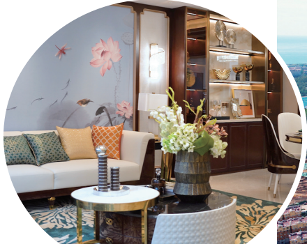
洋房采用精装交付。