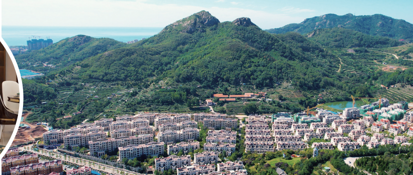
长在森林里的稀缺低密山居。

这里与山相依,近拥五山苍翠;以海为伴,约2公里直达沙子口海岸线;坐拥约7500亩原生密林和天然森林氧吧,尽揽清风暖阳;地铁四号线小崂山站就在家门口,高效绿色出行。本期“早报楼视+”记者来到波尔多·麗园,项目因地制宜,让山意、山趣、山景深融于园林中,打造一处长在森林里的稀缺低密山居。