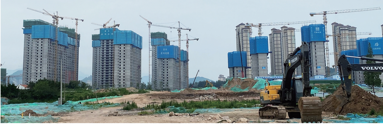
最高限价取消,对土拍市场影响不明显。

而就在昨天上午,三批次城阳区文阳路地块成功拍卖,共吸引三家竞买人参加,经过4轮出价,最终被山东海通地产有限责任公司以6866元/平方米竞得,总价