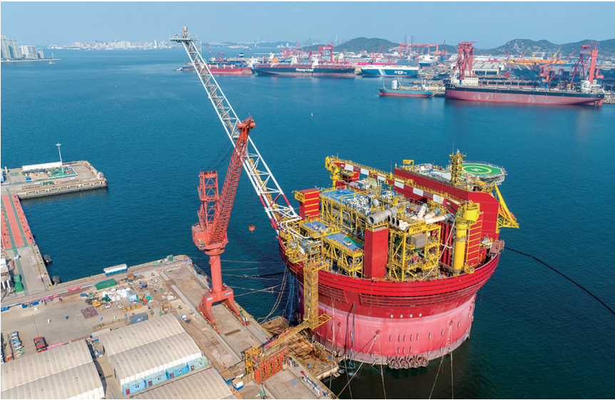
我国建造的最大圆筒型FPSO在西海岸新区完工交付。

海洋生物医药产业作为西海岸新区“5+5+7”重点产业之一，其发展壮大得益于西海岸新区对重点产业链的统筹推进。西海岸新区立足优势产业、着眼新兴产业，优选梳理九大重点产业链，全面实行“链长制”。从区级层面建立统筹调度机制，促进产业链大中小企业协同发展，合力解决企业遇到的困难和问题。同时，西海岸新区着眼于龙头带动作用，“链主”企业，引进外地头部企业、培育