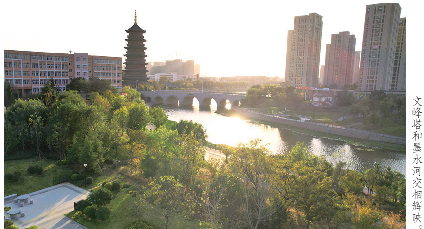
文峰塔和墨水河交相辉映。

为组长、办事处主任为副组长的农村人居环境整治工作领导小组,通过健全工作机制,五长护村制度、网格员全覆盖管理等