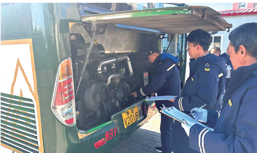
崂山巴士公司技能大比武现场。

武号令吹响，比赛正式开始，现场12名修理工们立即进入比武状态，熟练解答试卷，试卷内容包含日常维修工作中的工作原理、机械理论、注意事项以及车辆构造等题型，全面考查维修人员的理论业务能力。据悉，当天比武活动共分为理论考试和电动车绝缘检测实操两部分，为保障电动车辆在严寒天气的安全正常运行，如何使用各种仪器仪表、在最短时间内熟读电器参数以及能否正确掌握绝缘性能的检测方法成为本次比武练兵的重点。实操检测时比武人员沉着冷静，严格按照规范标准程序作业，有条不紊地对各处检测点进行正确读数，他们精湛的技术和快速检测能力赢得了现场人员的一致好评。