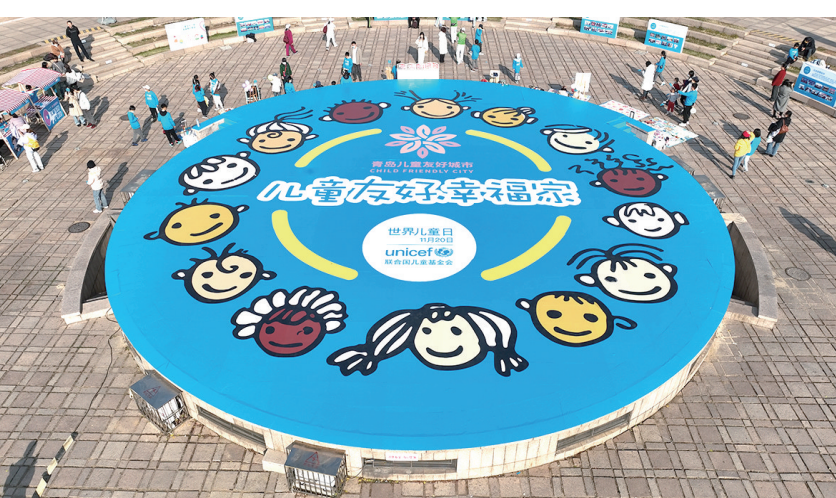
世界儿童日庆祝活动在五四广场举行。

11月20日是世界儿童日，是所有儿童的节日。为庆祝世界儿童日，展现青岛儿童工作取得的成绩，唤起全社会进一步关注和维护儿童的各项基本权利，市妇联、市发展和改革委员会、市文明办、市残联、市文化和旅游局、民进青岛市委、市南区人民政府共同举办“童享友好世界 点亮儿童未来”世界儿童日庆祝活动。据悉，这是青岛第二次参与联合国儿童基金会全球发起的“点亮儿童未来”活动。