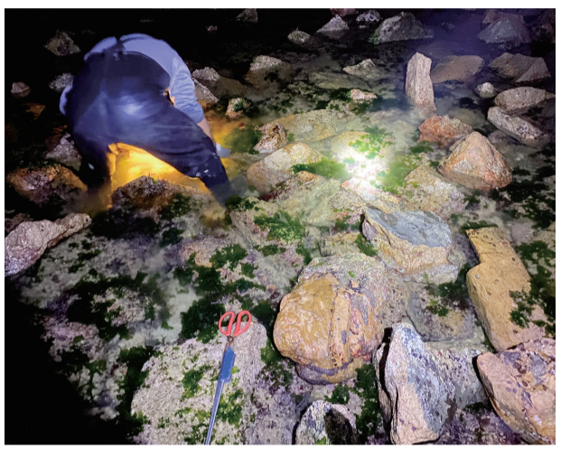
赶海人在石头缝里找“宝藏”。