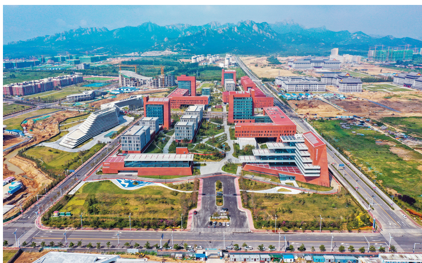
中国科学院海洋研究所新园区鸟瞰图。