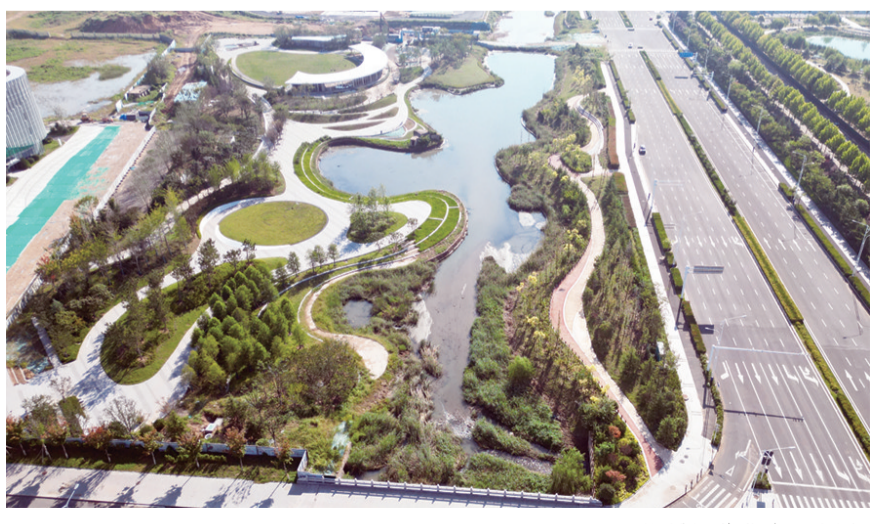
即墨区蓝谷滨河公园。

286个。建设过程中,充分利用原有地形,高低错落有致,因地制宜,打造立体公园;以简约模式,实现三季有花、四季常绿;高标准建设儿童活动区、老年活动区、各式运动场、风筝草坪等主题活动区、网红打卡地,实现推窗见绿、出门进