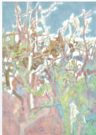
作品《润物细无声》水彩画。