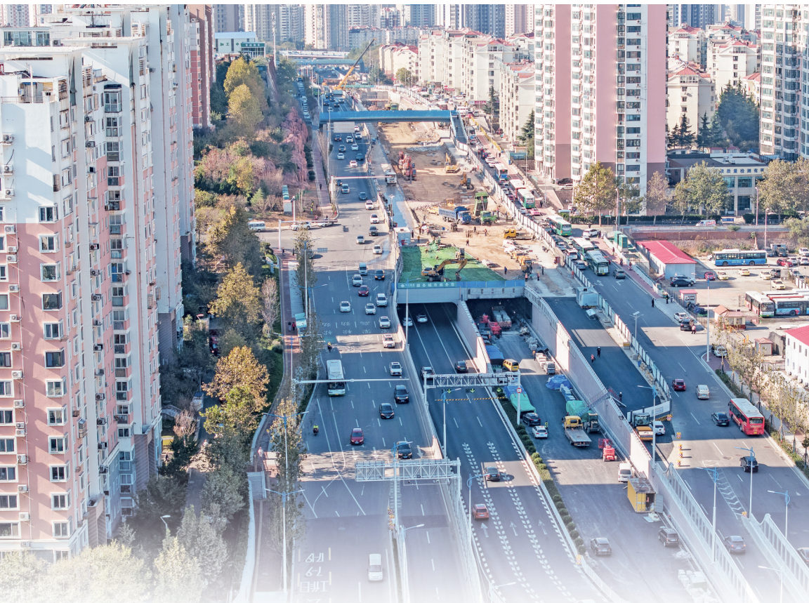
左图:辽阳路快速路工程北半幅地道主体结构封顶。