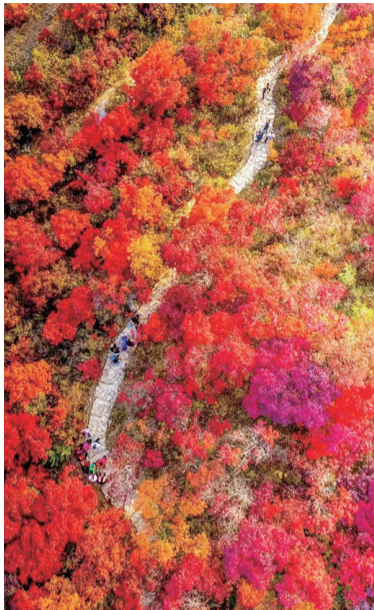
去淄博赏红叶正当时。

又是一年红叶季,深秋时节,青岛早报联合港中旅国际(山东)旅行社为读者专属定制省内精品二日游,深度玩转“火出圈”的淄博。两天的行程,游客将打卡“美食天堂”八大局,品尝特色美食;前往《闯关东》拍摄地周村古大街感受历史的气息;在网红打卡地最美图书馆——海岱楼钟书阁享受文化与视觉的双重盛宴;欣赏浓郁而浪漫的柿岩红叶;漫步文艺小众地颜神古镇;畅游陶瓷琉璃大观园感受琉璃的魅力……带您沉浸式玩遍淄博,品味市井烟火及博山美食!