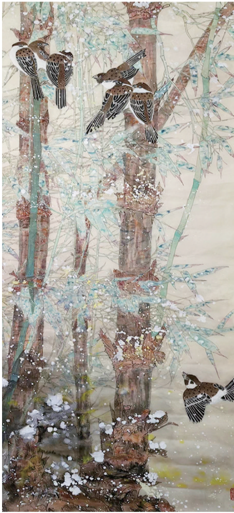
绘画 荆树红 56岁 市老年大学