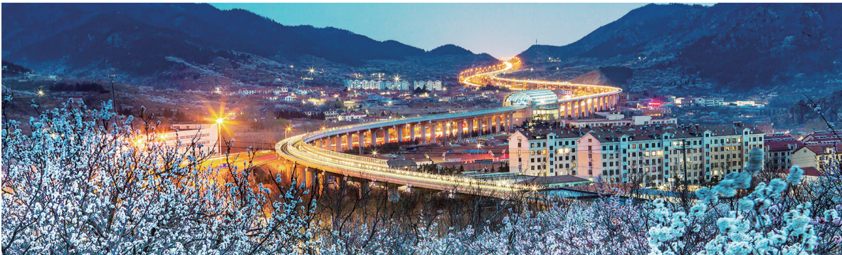
摄影《卧龙迎春》马艳波 60岁 市老年大学