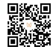
扫码观看相关视频