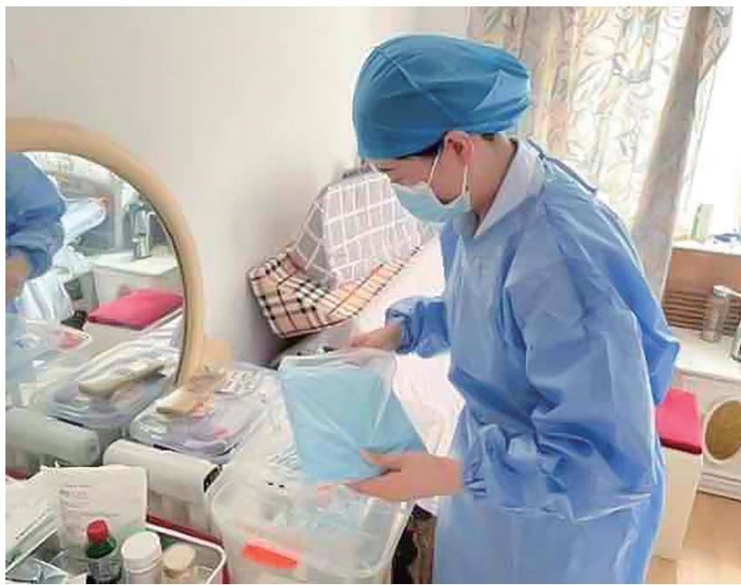
青岛市市立医院护士上门护理。

除了为有居家护理技术实操等需求的患者提供“网约护士”服务,青岛市市立医院常态化开展多项患者出院