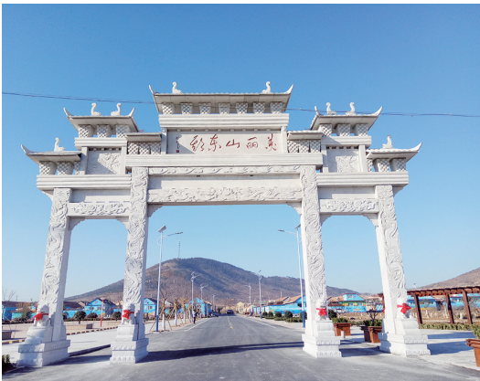
美丽乡村精品示范村山东头村。