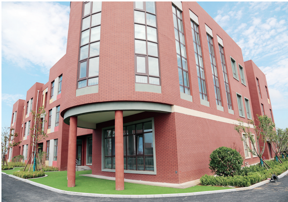
度假区新建中心小学(含幼儿园)项目。