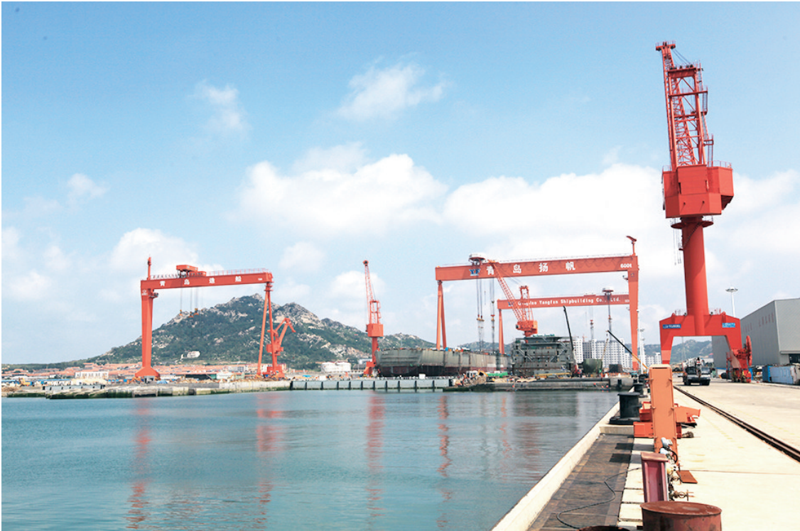
青岛造船厂有限公司。

为持续推动民生改善,全面建设幸福度假区,紧紧围绕“衣食住行、业教保医”,坚持在发展中改善和保障民生,不断增强人民群众的获得感、幸福感、安全感。一是办好民生实事。为进一步整合度假区教育资源,优化教育教学布局,2023年9月正式启用投资1.8亿元新建度假区中心小学幼儿园,合并5所小学、4所幼儿园。另外,针对群众关心的陆域交通问题,投资1279万元对江家屯路、山东头-田横码头路、南韩家屯路三条道路进行大中修。投资375万元实施东陆戈庄等4个村庄的5万平方米通户路硬化工作。2023年启动投资900万中心小学北路施工,推进投资480万南韩家屯路进场施工。二是谋划好扶贫与乡村振兴衔接文章。为保障度假区脱贫攻坚与乡村振兴有效衔接,2022年投资83.15万元实施大山前、迟家、田横岛3个村庄基础设施项目,帮助村庄改善村容村貌,完善基础设施。2023年投资215.62万元实施纪家庄、南营子、房家村基础设施项目,切实提升了农村人居环境,加快农业产业发展。