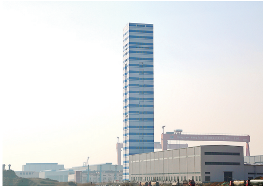
汉缆海洋工程产业链基地项目。