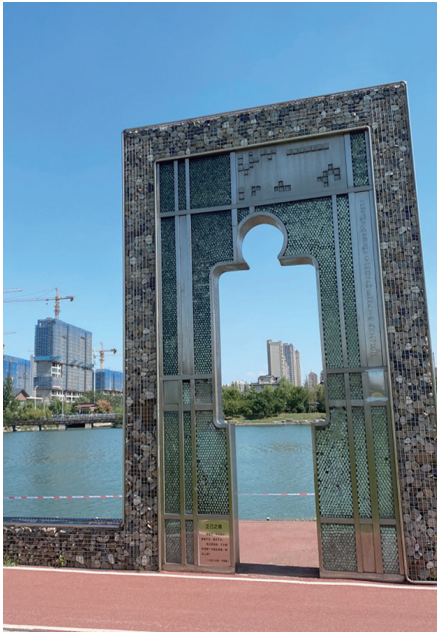
政策加码让楼市有回暖迹象。资料图片

从各区市新房成交环比变化来看,上月除平度、崂山、莱西外,其余区市新房成交均较前一个月上涨。根据青岛锐理数据统计,今年1—9月,青岛共计签约商品房1628亿元,1132万平方米、约