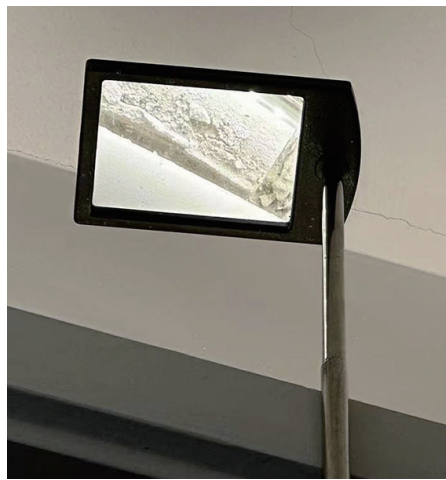
客厅天花板灯槽内污染明显。