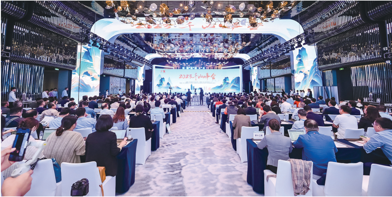
10月24日,2023千山峰会在青岛市崂山区开幕。

今年以来,崂山区广泛搭建发展平台,大力实施主导产业产才融合促进工程,构筑人才集聚高地。梳理30个年度人才平台(活动)清单,先后举办“人才赋能链接未来”金融人才大会、国际计算医学人才技术资本峰会、青年学者泰山国际论坛、元宇宙高端人才融合发展论坛等各类人才论坛、沙龙15次,最大限度激发和释放人才创新创业活力。高标准建设院士智谷、千山大厦、青岛海洋人才创新园等特色园区平台,持续放大人才平台集聚效应。出台金融、文旅和信息技术等产业专属人才政策,先后自主培育市级金融人才42人、齐鲁金融之星29人。推出人才配额制管理、企业政策定制权等举措,系统制定“汇智崂山”人才政策实施细则22项,