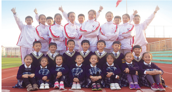
青岛超银学校师生风采。

2023年,是青岛超银学校建校25周年。回顾25年的育人岁月,自建校第一天起,每天都有一位老师站在校门口,与入校的每一位学生鞠躬行礼,通过这种言传身教,学生自然而然将文明礼仪教育内化于心。