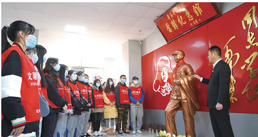
学生在青岛黄海学院雷锋纪念馆参观。