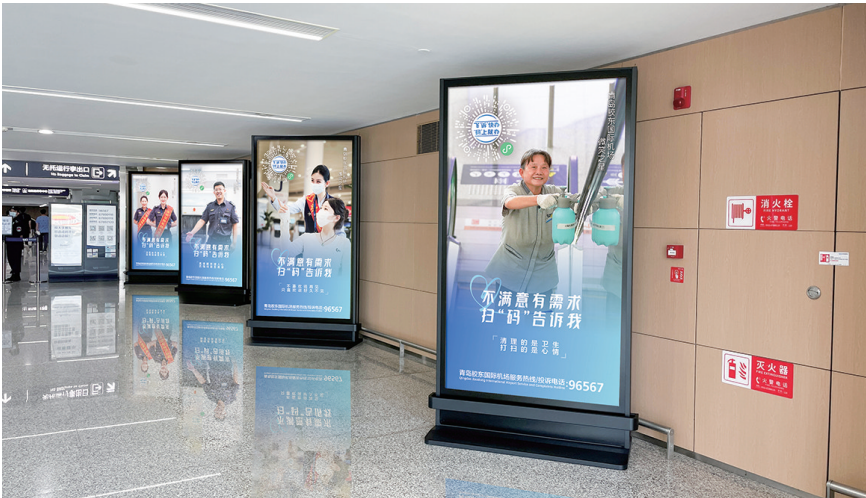
意见收集二维码覆盖进出港全流程每一个环节。

求解决体系,建立问题受理、限时办结、跟踪问效的闭环管理机制,实现旅客诉求快速响应、快速解决。 进一步拓展旅客发声渠道,常态化收集服务诉求。在登机口、安检候检区、行李提取区、到达接站区等明显位置,利用航站楼内布局的120余个电子引导屏幕,将意见收集二维码覆盖至进出港全流程每一个环节。同时在各登机口80余个充电桌以及登机牌背面进行设计推广,最大程度方便旅客随时反馈意见、需求。平台试运行以来,旅客满意度达到