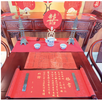
胶南街道婚俗文化和家庭教育宣教基地内展出的老婚书。

改革机制,丰富婚姻家庭辅导、婚姻登记服务、文明婚俗礼仪、优秀婚俗文化、良好家风家教“五大场景”内涵。 3年来,西海岸新区先后建立婚俗