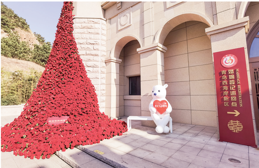
青岛西海岸新区婚姻登记巡回点。

改革机制,丰富婚姻家庭辅导、婚姻登记服务、文明婚俗礼仪、优秀婚俗文化、良好家风家教“五大场景”内涵。 3年来,西海岸新区先后建立婚俗