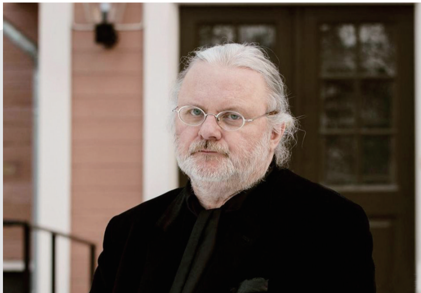
1959年出生的挪威剧作家约翰·福瑟。

就在刚刚过去的这个国庆假期,也即北京时间10月5日,备受关注的诺贝尔文学奖正式公布了获奖名单,挪威剧作家约翰·福瑟获此殊荣,以表彰他“创新的戏剧和散文,为不可言说的事情发声”。