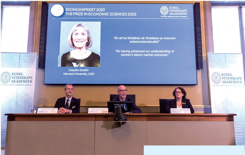
在瑞典斯德哥尔摩的2023年诺贝尔经济学奖公布现场,屏幕上显示奖项得主克劳迪娅·戈尔丁的照片。

瑞典皇家科学院9日在斯德哥尔摩宣布,将2023年诺贝尔经济学奖授予美国经济学家克劳迪娅·戈尔丁,以表彰她在女性劳动力研究领域的突出贡献。 瑞典皇家科学院当天发表声明说,戈尔丁发现了劳动力市场性别差异的关键驱动因素,她的研究成果“增进了我们对女性劳动力市场结果的理解”。 声明说,戈尔丁首次全面介绍了几个世纪以来女性收入和劳动力市场参与情况,她的研究揭示了变化原因以及仍有的性别差距的主要根源。戈尔丁的研究表明,女性劳动力市场参与率在整个时期内并没有呈现上升趋势,而是形成“U”形曲线。19世纪初,随着从农业社会向工业社会的转变,已婚妇女参与程度有所下降,但随着20世纪初服务业的发展,已婚妇女参与程度开始增加。戈尔丁将这种模式解释为结构性变化和关于女性对家庭责任的社会规范不断演变的结果。 声明还援引诺贝尔经济学奖评委会主席雅各布·斯文松的话说,了解女性在劳动力市场中的角色对社会很重要。“得益于戈尔丁的开创性研究,我们现在对潜在因素以及未来可能需要