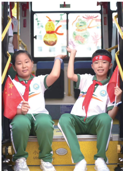
小学生打卡彩绘主题车厢。

10 月 4 日晚,中央电视台综合频道关注报道了李沧巴士 207 路“有安全更团圆”彩绘主题车厢。记者了解到,中秋国庆假期前,李沧巴士联合李沧区教育和体育局共同开启“贺中秋 迎国庆 小手送祝福 绿色出行扮靓城市窗口”主题活动。活动中,来自李沧区 45 所中小学和幼儿园的近千名学生布置装饰了 45 辆公交车的彩绘车厢。节日期间,这 45 辆公交车全部投入运行,升级了乘客的乘车体验。自投入运行以来,彩绘车厢已运送了近 10 万名乘客,“以前车厢内只是单调的座椅和广告牌,现在却成了一个充满艺术气息的空间。”乘坐主题车厢的乘客表示。