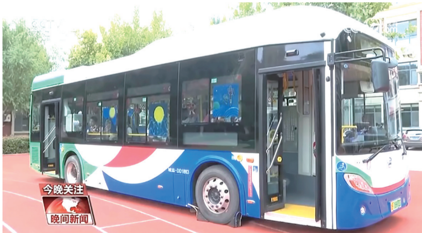
中央电视台综合频道报道李沧巴士彩绘主题车厢。视频截图

车厢顶部和扶手上缠满了绿色藤蔓,一个个葫芦挂在藤蔓上,跟随着车厢移动摆动,整个车厢仿佛变成了葫芦娃的世界……10 月 5 日,岛城市民李女