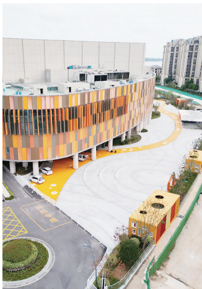
海上嘉年华会展中心外景。