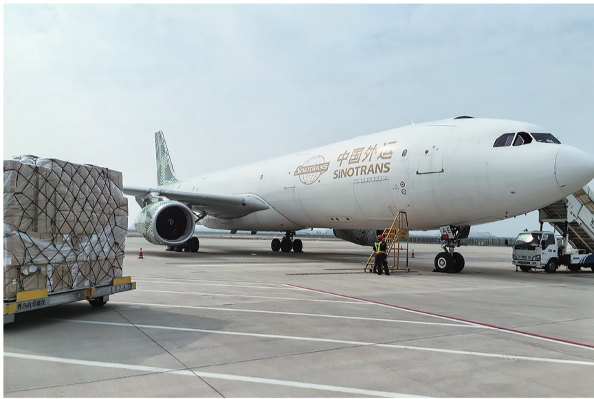
全货机8S5913航班顺利落地青岛机场。