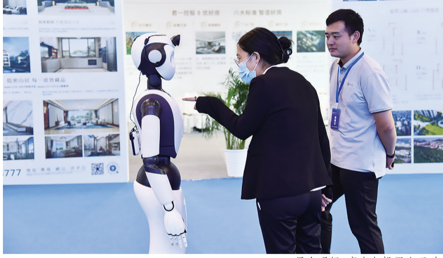
展会现场,嘉宾与机器人互动。

除了城市建设,以“宜居城市 绿色发展”为主题的宜博会,同样在智能建造、绿色发展方面进行了相关展示。特别是随着建筑业迭代升级,越来越多让人眼前一亮的建造场景已经落地。在本届宜博会上,百余家企业和机构集中亮相,展示住建领域的新技术、新产品、新应用、新成果。在海纳云展区,工作人员向记者展示了其专为青岛打造的“青岛市城市安全风险监测预警平台”,这个平台不仅可以在事故发生之前进行预警,