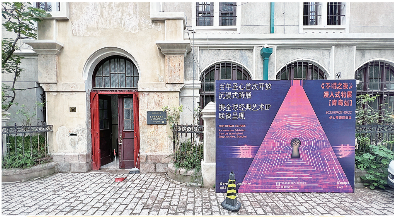
沉浸式戏剧《不眠之夜》特展“窥梦”在圣心修道院旧址启动。

海誓山盟广场西北角坐落着一座欧式建筑,这就是浙江路28号的圣心修道院旧址。圣心修道院始建于1901年,是青岛百年历史的见证者。9月底,修葺一新的这里首次引入来自上海的沉浸式演艺头部IP——浸入式戏剧