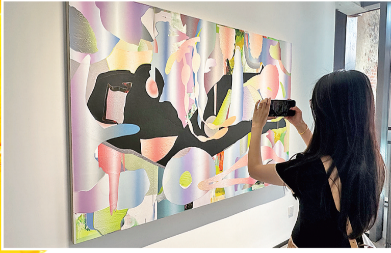
一名市民在“画廊周北京”延伸展览上拍照。

《不眠之夜》特展“窥梦”,将静态展览与沉浸式互动体验精妙融合,打造“历史文化建筑+沉浸式先锋演艺”的跨界文旅模范案例。在中秋国庆假期来临之际为市民游客带来亦幻亦真、熟悉又新鲜的体验。