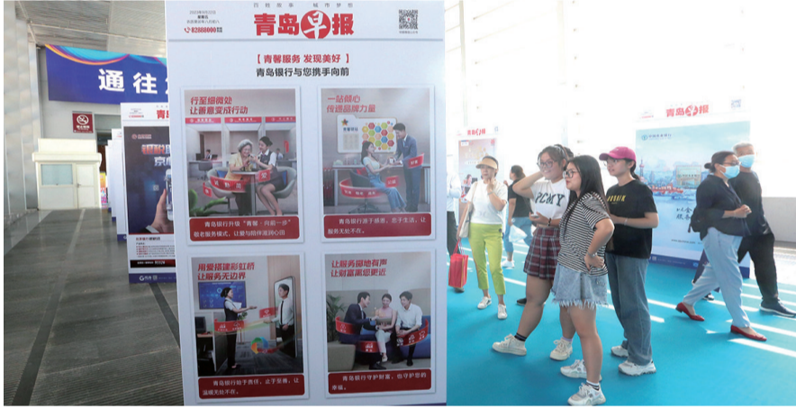
青岛早报的“巨报展”吸引了参展者驻足观看。

超银学校也将继续在品牌之路上不断探索,从超银口碑向超银品牌不断转变,不断助推教育的高质量发展。我们希望把超银在这些方面的一些好的做法向社会进行展示,期待着教育行业能够出现越来越多的优质品牌。同时,我们也希望和来自各行业的优秀品牌进行交流,向其他的行业品牌学习、借鉴、取经,能够促使我们进一步跳出教育做教育,为超银的品牌发展赋能,也为青岛这座品牌之都增添一抹教育品牌的亮色。”