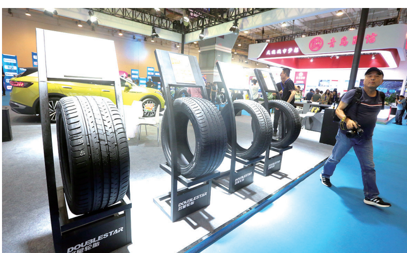
参展的双星轮胎产品。

看到青岛啤酒的身影。作为青岛最具代表性的企业之一,青岛啤酒在品博会上重磅亮相,并别出心裁地在展台搭建了一个复古风格的酒吧,市民可以在酒吧里感受青岛啤酒的独特魅力。