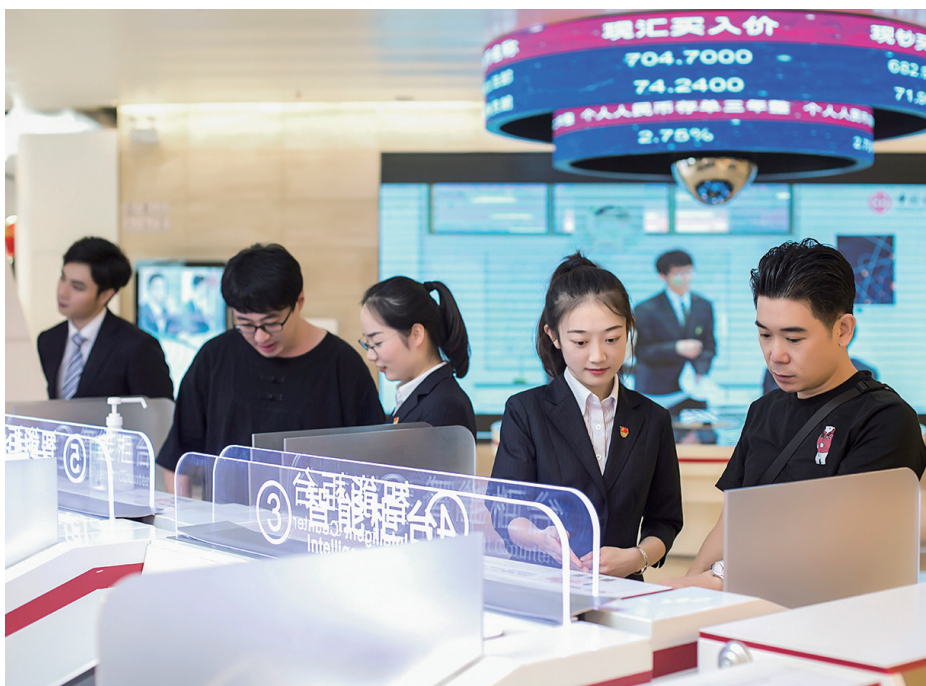
青岛中行员工为客户提供细心周到服务。