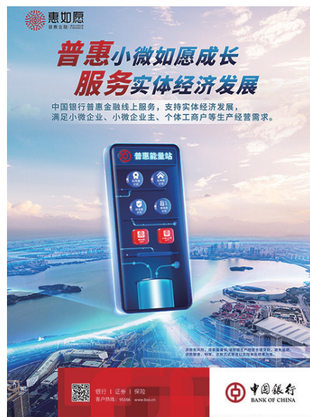
中国银行普惠服务展示。

务深化改革扩大开放,充分发挥外汇外贸专业优势,全力支持外向型经济发展,紧抓上合示范区、自贸区、“一带一路”等国家战略政策机遇,累计为全市1.2万家企业提供跨境贸易服务,国际业务市场份额连续多年稳居同业首位。