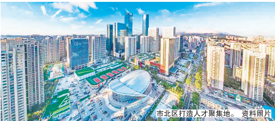
市北区打造人才聚集地。 资料照片