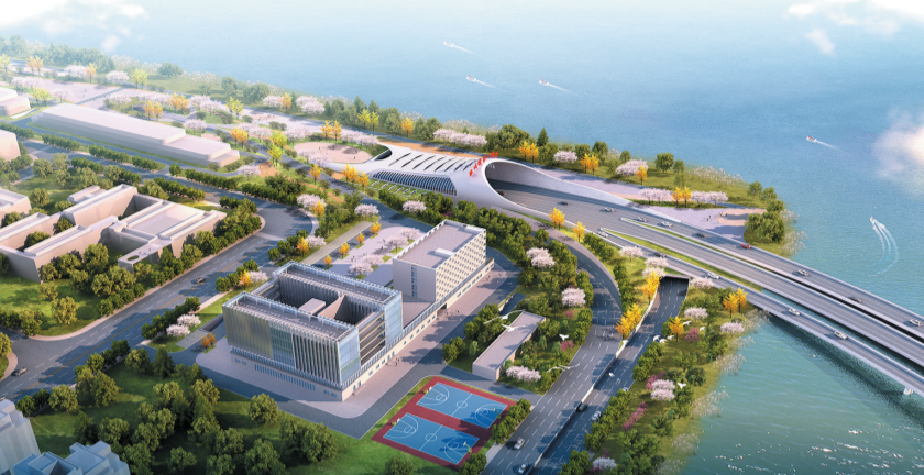
青岛国信集团投资建设的胶州湾第二隧道工程效果图。

9月22日至24日,2023青岛国际品质生活博览会(以下简称“品博会”)将在青岛国际会展中心举行,来自全省16地市的数百个知名品牌将齐聚岛城,带来一场精彩绝伦的“品牌盛宴”。即日起,青岛早报将开设《2023青岛国际品质生活博览会参展品牌巡礼》专栏,展示品博会参展品牌风采。