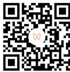
扫码观看 品质好房

享独门院落，私享归家动线，将家庭生活空间、自然院落和地下车库连为一体，与众不同的平墅空间设计，为业主筑就三代同堂、代代传承的家族恒产。观海新闻/青岛早报记者 李茂