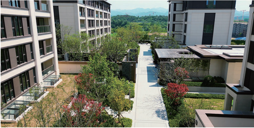
和达·和山项目实景。视频截图

和达·和山位于世博园板块改善区，项目北靠石门山、戴家山、卧龙山，南面水，三山合围，背靠 3A 景区竹子庵，尽享茂林修竹生活逸趣，同时 4A 景区世博园近在咫尺，绿地覆盖率达 71%，是城市中