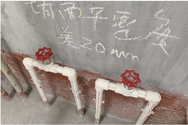
厨房墙面平整度差 20 毫米。