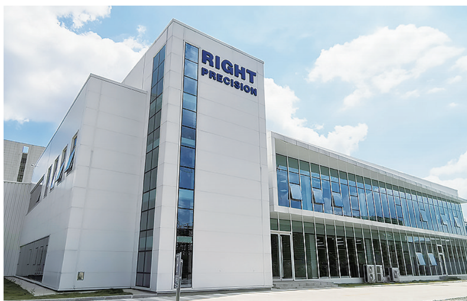
来易特医疗设备项目。

人数约90人。 记者了解到,来易特制作所成立于1947年,是专业的医疗设备、半导体设备和液晶面板制造商,目前已发展成为融合精密设备与电子工程两大技术的机电一体化总承包制造商,该公司研发生产的眼科仪器精准度位居世界第一。公司在产品制造与加工领域拥有核心的机电一体化技术,尤其是在大型产品的精密加工方面居于日本领先地位,主要客户为尼康光学仪器、佳能医疗设备等世界知名厂商。 (观海新闻/青岛早报记者 张孝鹏 通讯员 朱雨辰)