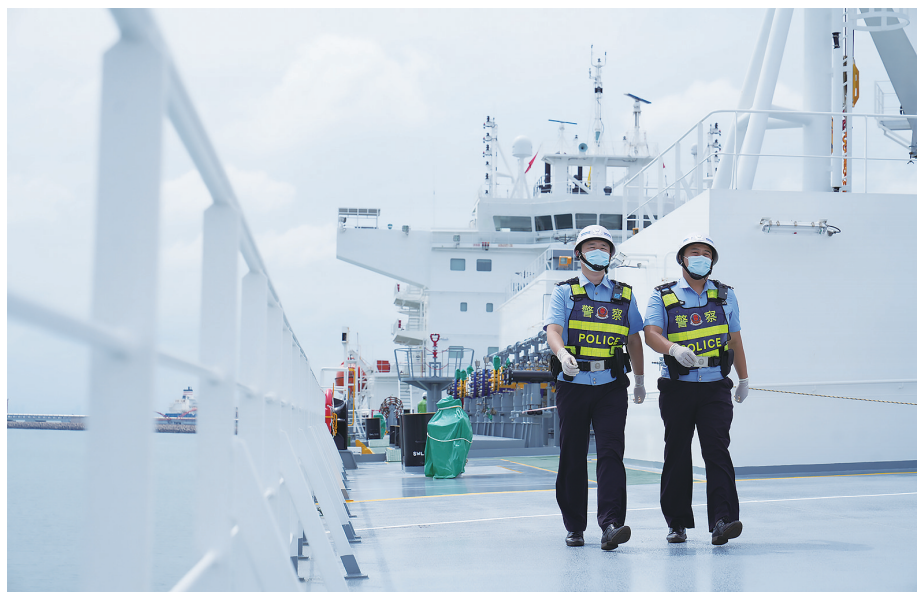
董家口边检站完成“里格尔”轮入境检查任务。

为更好地服务“里格尔”轮入境靠港,该站充分利用梅沙系统、船讯网及出入境数据应用平台分析该轮航行轨迹、船员基本信息、锚地锚泊动态等情况,在“单一窗口”网窗系统进行船舶预报预检,最大限度缩短手续办理和通关时间,降低企业运营成本,实现了通关“零等待”“零延时”。 据了解,截至9月份,董家口边检站护航该液体化工码头安全靠泊外贸船舶30艘次,为山东省重点项目金能化学(青岛)有限公司输送低温丙烷原料超过2022年全年吞吐量总和。