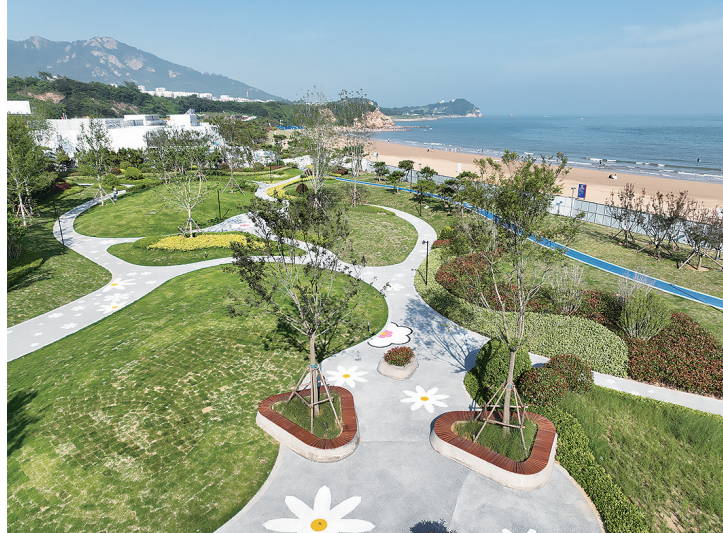
崂山区黄金海岸口袋公园。