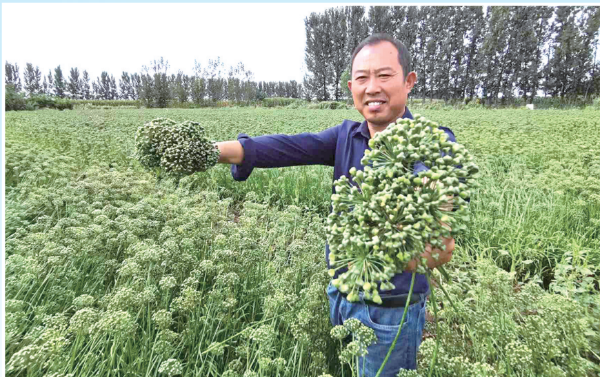
村民在韭菜基地采摘韭菜花。