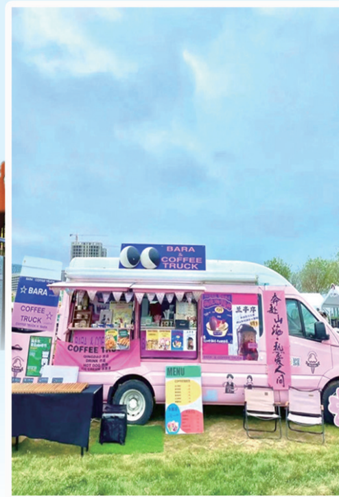
今年5月举办的海东东咖啡节。

9月12日,记者在市北区中车四方智汇港新闻发布会上获悉,四方机厂1900“青岛城市生活艺术季”将于9月13日—10月28日举行。本次艺术季将围绕“一个主题、两个节日、三场展览、四大活动亮点、五大创新举措”,以全新的生活态度和方式,将工业文化与人文活动深度融合,打造一场极具潮流、创意、活力的艺术主题活动,感知工业文化与在地人文,共融艺术创作与理享生活,连接市井烟火与精致体验。