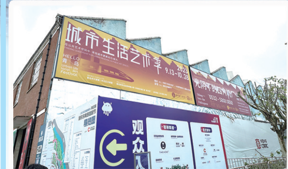
四方机车公园。