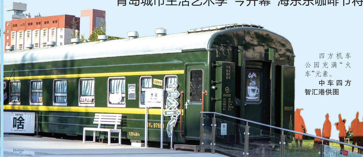
四方机车 公园充满“火 车”元素。