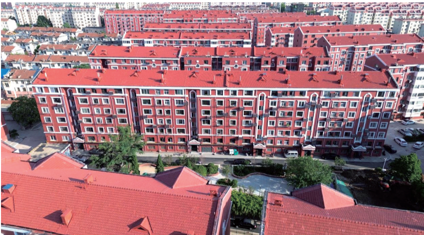
改造后的水寨花园一期。