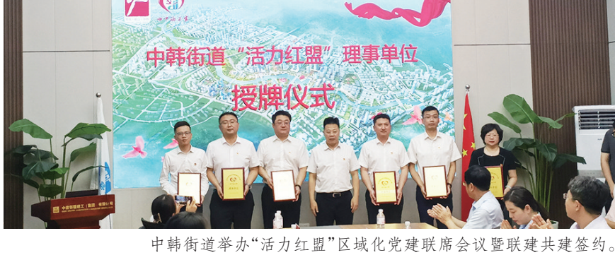
中韩街道举办“活力红盟”区域化党建联席会议暨联建共建签约。

这次活动以城市更新与城市建设联建共建为主题,街道与相关建设、银行等单位,拆迁社区与相应的代建、施工、监理单位集中签订了区域化党建共建协议,这是扩大联盟朋友圈、改善营