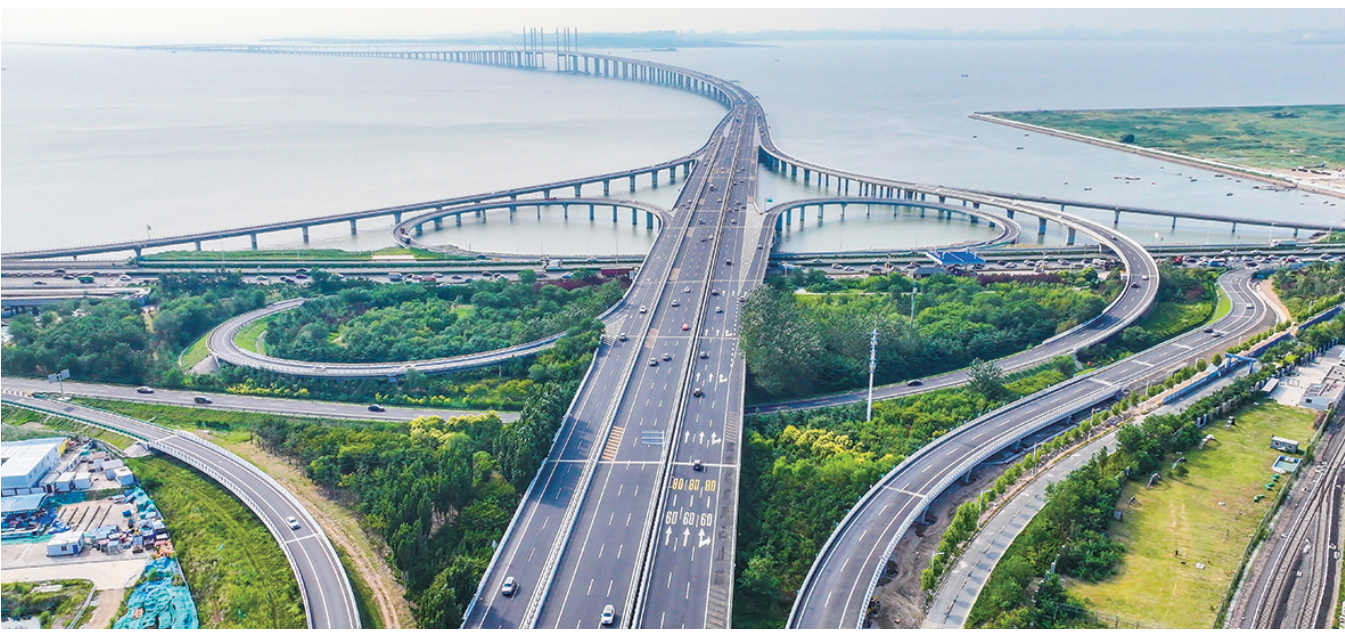
8月18日下午,李村河互通立交G匝道拓宽改造工程完工。图右侧为G匝道。

“从去年9月以来,李村河互通立交G匝道拓宽改造工程作为青岛市重点工程,就一直处于紧张有序的施工状态,我们积极对接协调多个部门,优化调流方案,在保障施工质量安全的前提下,将封闭匝道时间由原方案的3个月压缩到10