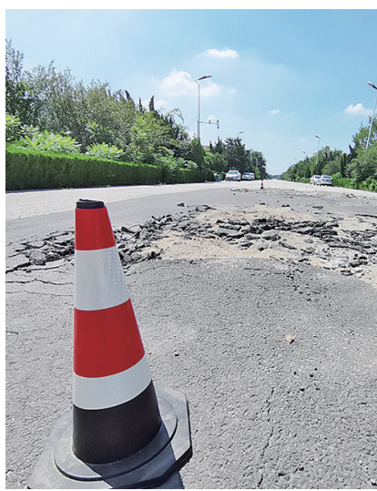
部分“陷阱道路”放置“安全帽”。

在“陷阱道路”曝光之後,記者又陸續接到當地多名居民反映,道路經過一場大雨後,比以前更加難走;個別路段在大雨後變成一片“澤地”,基本上無法通行,尤其是晚上更不敢走。附近村民還反映,不僅園區企業員工上下班不方便,他們多數人騎電動車路過,出行更加不便。 15日上午,記者再次來到北園區內看到,一場大雨過後,多條道路的狀況比