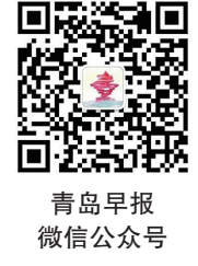
青島早報 微信公眾號

如果你在青島生活、學習、工作中遇到難解決的煩心事,或者發現一些有意思的社會現象以及話題,都可以通過青島早報熱線電話82888000或在青島早報微信公眾平台留言聯繫我們,青島早報“熱線幫”當值記者將第一時間與你聯繫,做好溝通的橋樑,幫你一起想辦法。