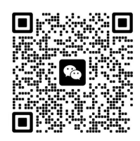
扫码加入早报银龄俱乐部