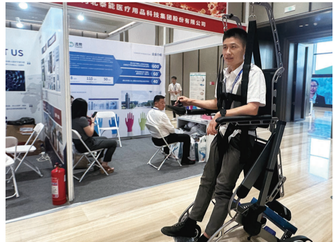
广东汇博机器人技术有限公司的智能助行机器人。