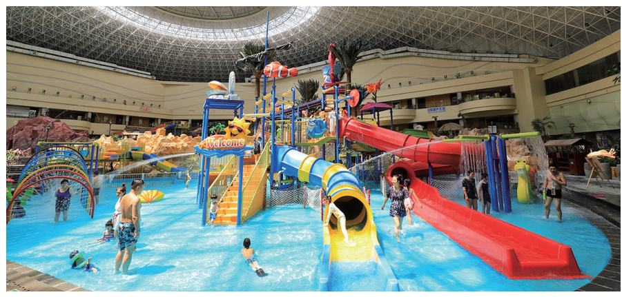
即墨海泉湾水上乐园。

夏日爬崂山会有不一样的清爽体验。湛蓝的天空在青山碧海的映照下显得愈发透亮。作为崂山的一大景点，崂山太清宫三面环山、一面临海，冬无严