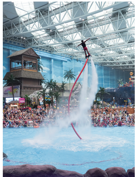
青岛融创水世界水上飞人。

寒、夏无酷暑，是最适宜养生居住的风水宝地。太清游览区还是青岛市古树名木最集中的地方，其中一百年以上的古树有70多棵。