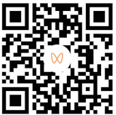
扫码观看 品质好房

在户型设计上,灵山湾悦府重新解构室内空间的建造方式,更为居住者带来了人性化、个性化的体验。不惜成本减少剪力墙的应用,拓宽居住空间尺度,采用LDK一体化设计,让动区互联,达到动静分离的效果,创变空间设计,让居者根据不同需求随意改变格局,合理的功能分区,让每位家人之间均能各得其所。 观海新闻/青岛早报记者 刘鹏