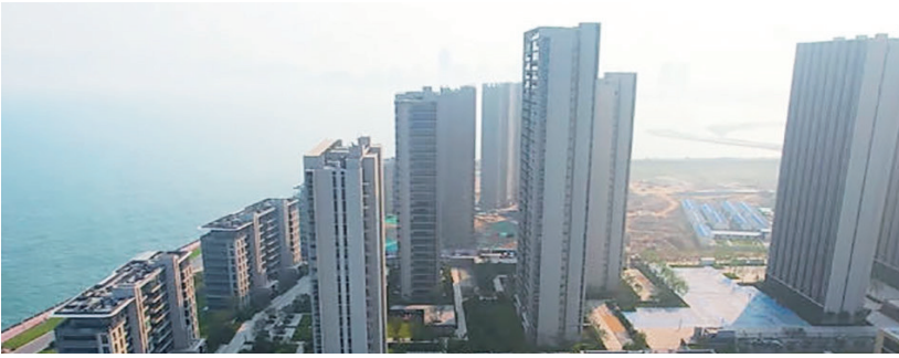
与海零距离的海景房。视频截图

作为青岛的城市名片,经过这些年的发展,灵山湾片区各种大型的商业配套齐全,例如融创茂、德信利群,以及新建的奥体中心等相继落地。赫德双语学校、北京二十一世纪国际学校、珠江路小学分校等名校也逐渐落地,地铁交通医疗设施也逐渐配齐。山海相连,拥有一线山景海景、足够体量的商业配套以及地铁交通网络发达的灵山湾,放眼全国楼市,已经属于资源顶配的片区。