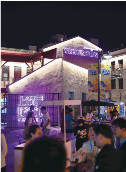
上街里·啤酒节野馄饨专场有滋有味。