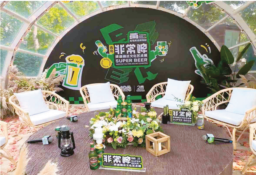
首届啤酒潮流文化艺术展在太平湾开启。