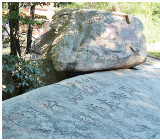
明邹善邀月台“邀月”刻石。