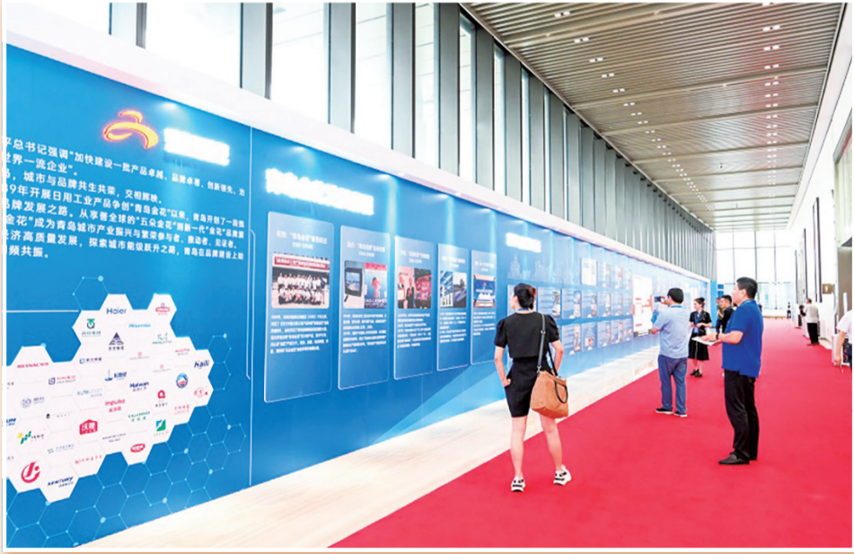
2023年青岛品牌日当天,青岛品牌建设历程展同步亮相。