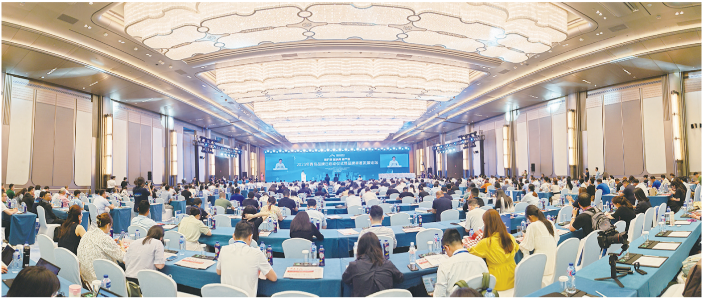
2023年青岛品牌日系列活动在青岛国际会议中心启动。