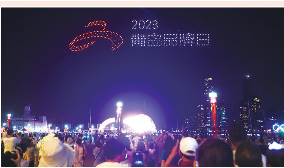
致敬青岛品牌·大型展演秀现场。